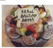
クラシック ショコラ