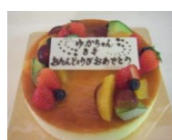
プレミアムチーズ